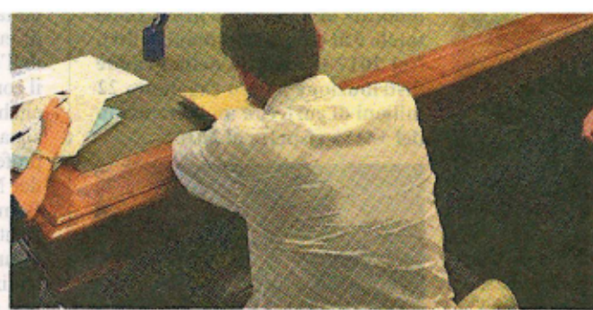
Il tavolo di confronto tra il Comune e le società dei trasporti